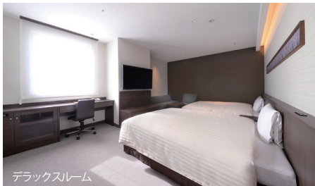
デラックスルーム