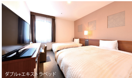
ダブル+エキストラベッド