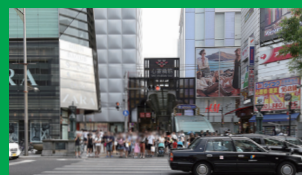
心斎橋筋商店街 ホテルから徒歩3分