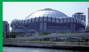
京セラドーム大阪 ホテルから17分 乗り換えなし／「ドーム前千代崎駅」から徒歩7分