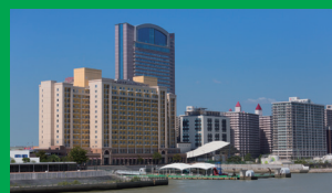
ユニバーサルシティ駅 ホテルから車で23分