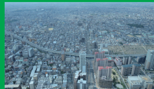
あべのハルカス ホテルから15分 乗り換えなし／「天王寺駅」から徒歩2分