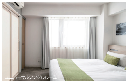
コバーサルシングルルーム