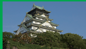
大阪城 ホテルから25分 乗り換えなし／「森ノ宮駅」から徒歩12分