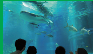
海遊館 ホテルから32分 「大阪港駅」から徒歩10分