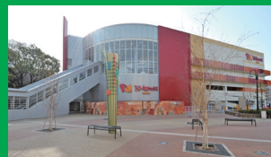
キヤセラ甲子園 ホテルから45分 「甲子園駅」から徒歩13分