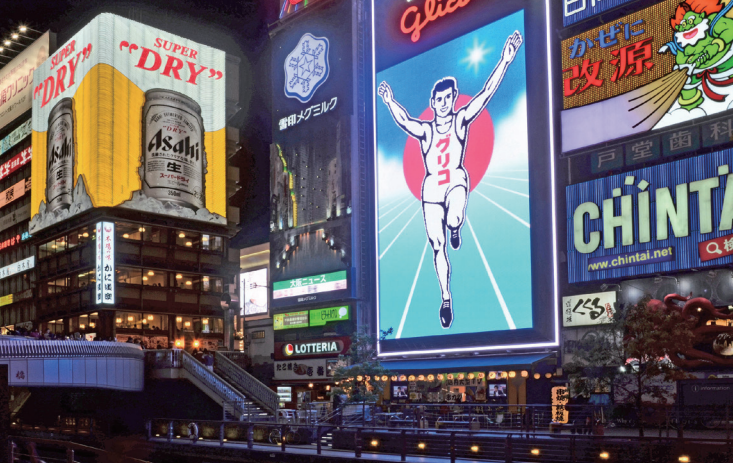
道頓堀 ホテルから徒歩13分