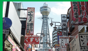
通天閣 ホテルから12分 乗り換えなし／「恵美須町駅」から徒歩5分