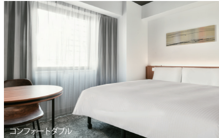
コンフォートダブル