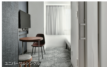
ユニバーサルシングル