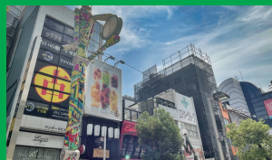
アメリカ村 ホテルから徒歩5分