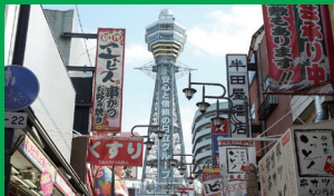
通天閣 ホテルから12分 乗り換えなし／「恵美須町駅」から徒歩5分