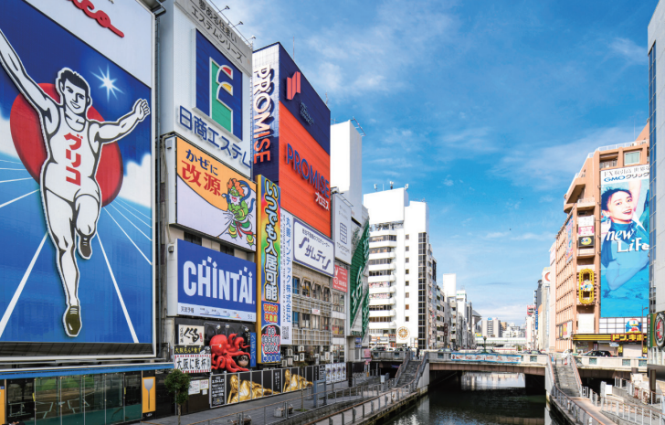
道頓堀 ホテルから徒歩4分