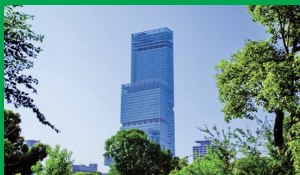
あべのハルカス ホテルから15分 乗り換えなし／「天王寺駅」から徒歩2分