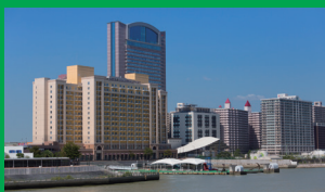
ユニバーサルシティ駅 ホテルから電車で約26分