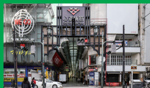
心斎橋筋商店街 ホテルから徒歩3分