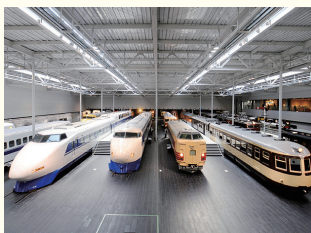
リニア・鉄道館 ホテルから約21.5km、約30分(車利用)