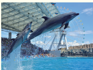
名古屋港水族館 ホテルから約11.2km、約23分(車利用)