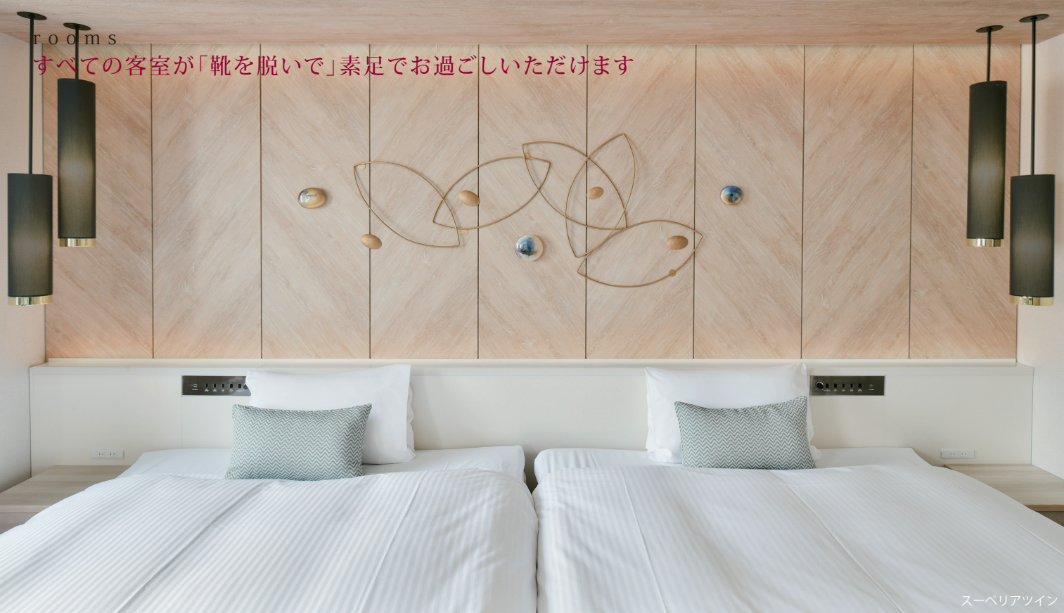
スーベリアツイン