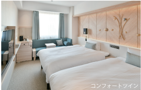
コンフォートツイン