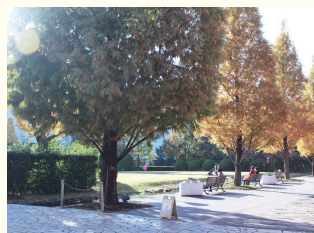
ノリケの森 ホテルから約550m、徒歩約10分