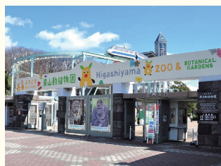
東山動植物園 ホテルから約13km、約25分(車利用)