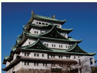
名古屋城 ホテルから約1.8km、約6分(車利用)、徒歩21分