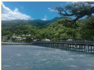
嵐山 ホテルから約35分