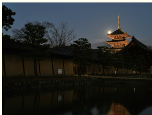
東寺 ホテルから約20分