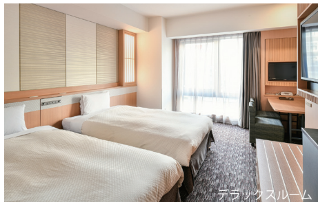
デラックスルーム