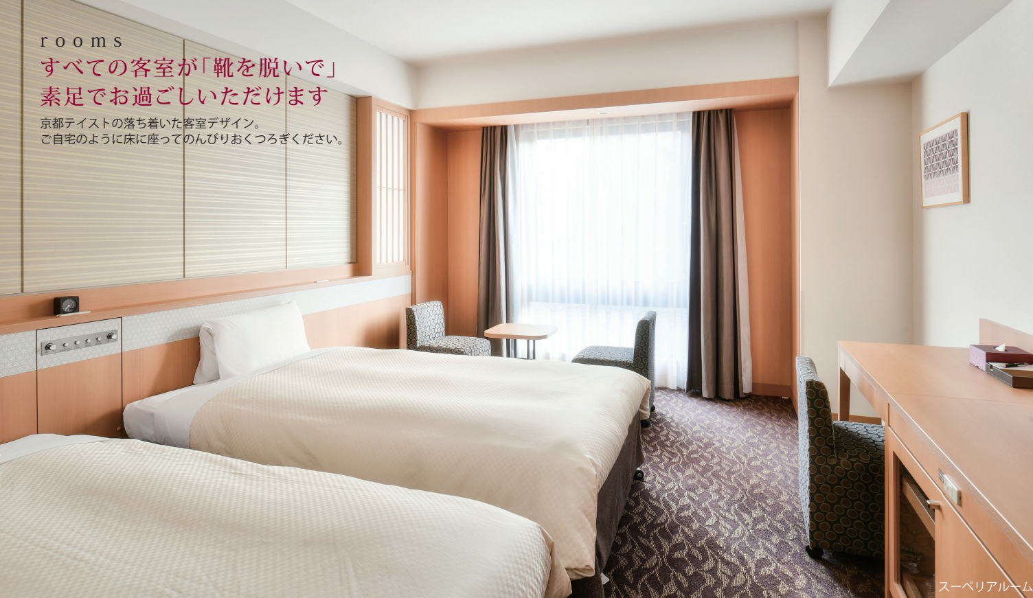
スーペリアルーム

京都テイストの落ち着いた客室デザイン。 ご自宅のように床に座ってのんびりお過ごしください。