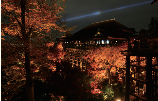
《世界遺産》清水寺 ホテルから約20分