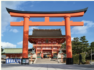
伏見稲荷大社 ホテルから約30分