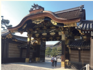
《世界遺産》二条城 ホテルから約20分