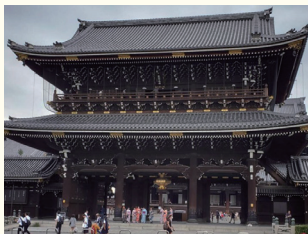
東本願寺 ホテルから約10分