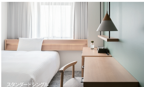
スタンダードシングル

グリーンをアクセントに、モダンシンプルな五感に響く落着きのひとときをご提供します。お一人のご利用から大人数でゆったりお使いいただけるお部屋まで、自由なスタイルでご滞在ください。