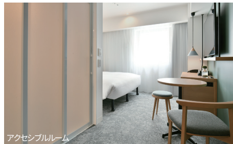
アクセシブルレーム