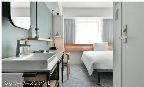
シャワーブースシングル