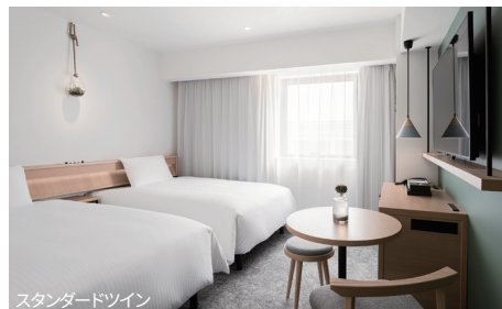
スタンダードツイン