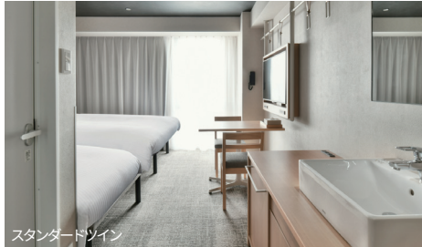
スタンダードツイン