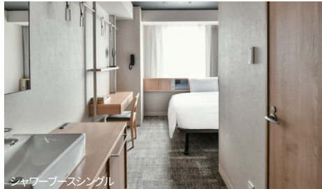
シャワーブースシングル

お一人のご利用から大人数でゆったりお使いいただけるお部屋まで、自由なスタイルでご滞在ください。