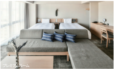
プレミアムルーム