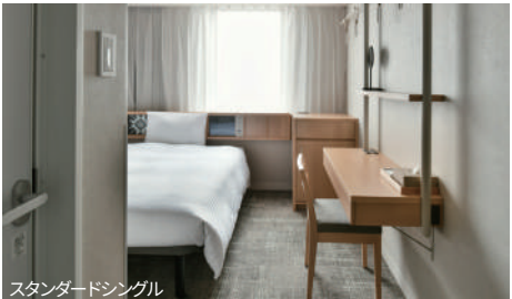
スタンダードシングル