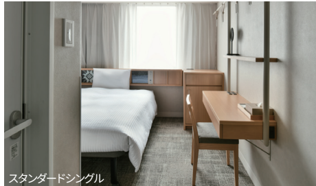
スタンダードシングル