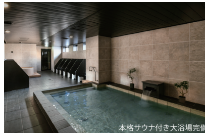
本格サウナ付き大浴場完備