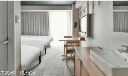
スタンダードツイン