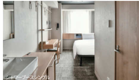
シャワーブースシングル

お一人のご利用から大人数でゆったりお使いいただけるお部屋まで、自由なスタイルでご滞在ください。