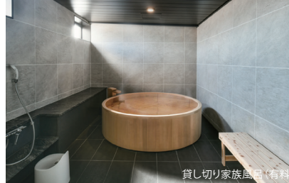
貸し切り家族風呂 (有料)