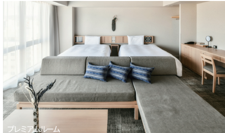
プレミアムルーム