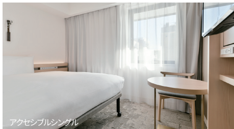
アクセシブルシングル