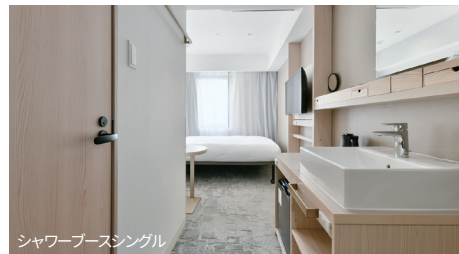
シャワーブースシングル