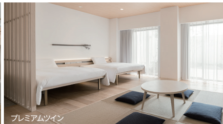
プレミアムツイン