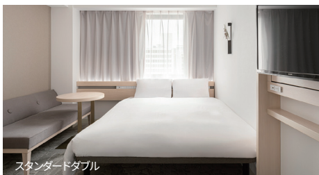
スタンダードダブル

和の要素と、座・側・床を組み合わせ、モダンシンプルな五感に響く落ち着きのひとときをご提供します。お一人のご利用から大人数でゆったりお使いいただけるお部屋まで、自由なスタイルでご滞在ください。