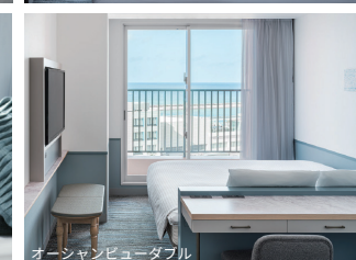
オシャンビューダブル