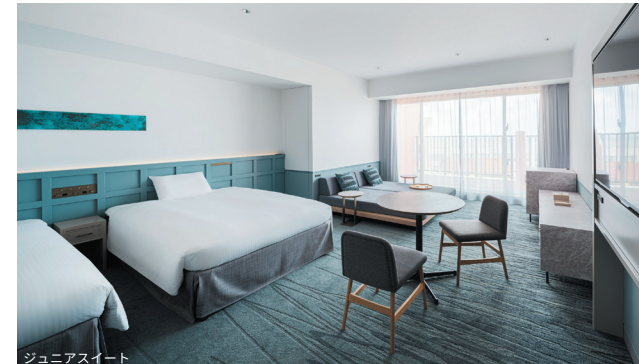
ジュニアスイート

家具やファブリックも素材にこだわり、モールを使った家具や、肌ざわりを重視したファブリック を用いました。