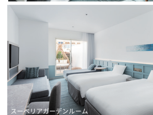
スーパーリアガーデンルーム