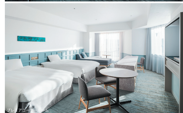
プレミアコーナールーム